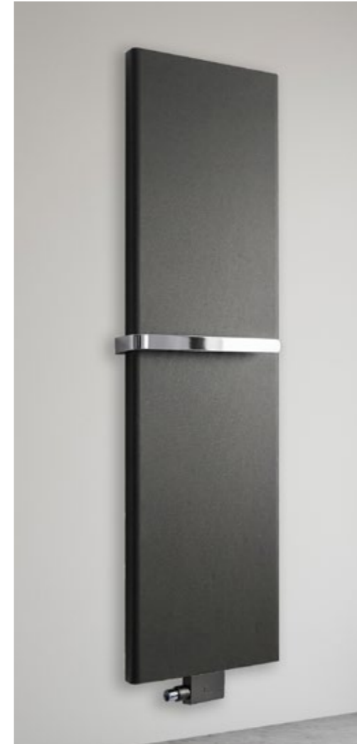
Die optimale Ergänzung: Das BEMM-M-Ventil Purline im Farbton des Heizkörpers. Abb. zeigt REISSER THERM HK50 mit M-Ventil Purline im Farbton Samtmetallicgraphit (YA).