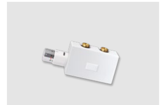
Optionales Zubehör: BEMM-M-Ventil Purline mit Thermostat Puro Eckform (Art.Nr.: TR68/04) Durchgangsform (Art.Nr.: TR69/04)