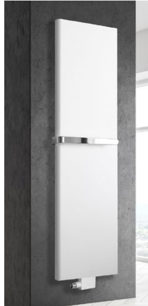
Abb. zeigt REISSER THERM HK50 mit M-Ventil Purline im Farbton Weiß RAL 9016.