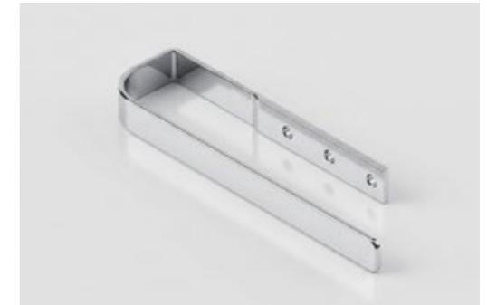
Optionales Zubehör: REISSER THERM HK50 Handtucharm, verchromt, Länge 425 mm (Art.Nr.: TR103/1) oder 525 mm (Art.Nr.: TR103/2).